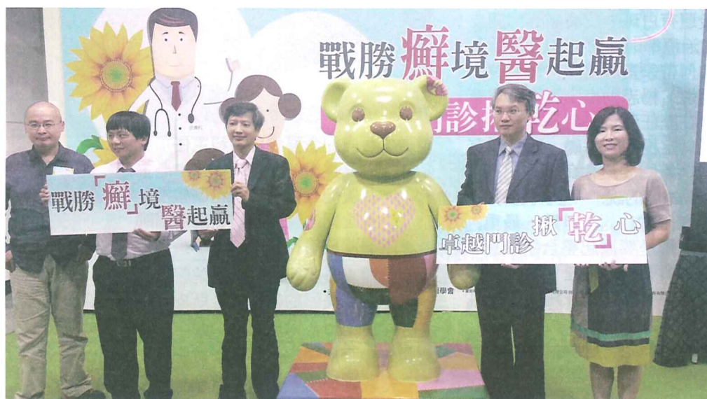
主辦單位以「乾癬熊」身體呈現的圖案比喻成乾癬病灶，傳達破除錯誤迷思的正確觀念。

民眾可至臺灣皮膚科醫學會網站查詢「乾癬卓越門診」，根據自己需求就近尋找合適的醫療資源。